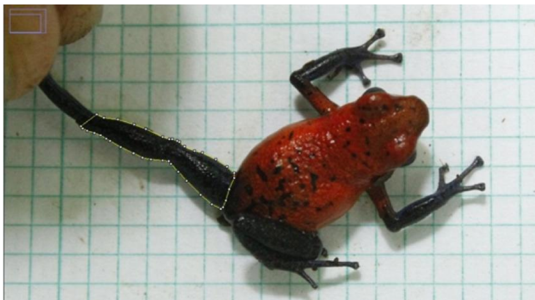
Figura 1. Medición del área fémur-tibia (AFT) de un macho de O. pumilio en la Estación Biológica La Selva, Costa Rica.

Las búsquedas se realizaron entre las 08:00-11:00 horas y las 14:00-17:00 horas. Al encontrar un individuo vocalizando este fue capturado y fotografiado